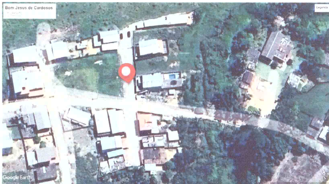
Imagem 1- Visualização do ponto de Referência indicado pelas coordenadas geográficas.

A Rua Travessa C, encontra-se ao Distrito de Bom Jesus de Cardosos, Trevo da Sorte, conforme representado no ponto de referência geográfica, no qual foi usado coordenadas o aplicativo GOOGLE EARTH, (ver Imagem 1-), sendo as coordenadas geográficas (S= 20°20' 18"; W= 42°26' 21.81" e representado em um PLANTA DE LOCALIZAÇÃO em ANEXO.